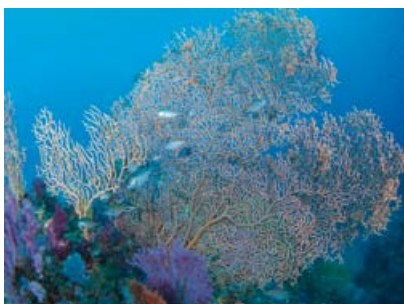
【搭配 UWL-H100 28LD】

■ 相機: Canon PowerShot S95 ■ 閃光燈: 2× S-2000 ■ 潛點: 日本靜岡縣熱海