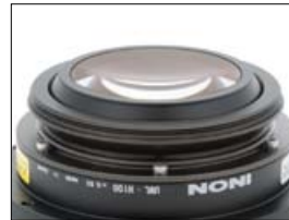
28M67 Type 1 的透鏡尾端突出