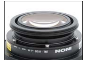
28M67 Type 2 的透鏡尾端高度和接環貼齊