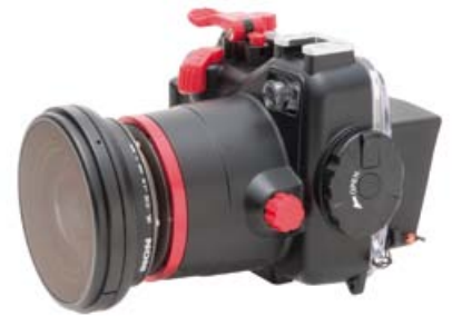
透過M67鏡頭環直接接上防水殼上