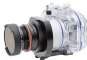
旋在專用的接環轉換器上，以搭配鏡頭罩接環底座。