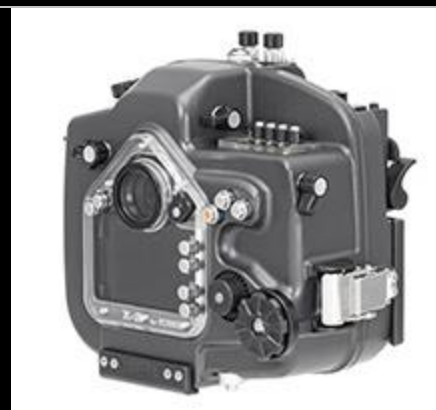
X-2 for EOS80D VC PF2