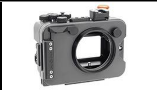
X-2 for GX9 VC

INON INC. 很榮幸地宣布於 2020 年 1 月 29 日發佈安裝真空漏水偵測器的防水殼，以便於使用者在潛水之前檢查是否正確密封。