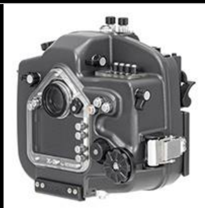
X-2 for EOS80D VC FW