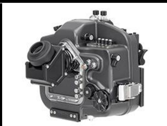
X-2 for EOS80D VC 45VF-II