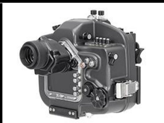
X-2 for EOS80D VC STVF-II